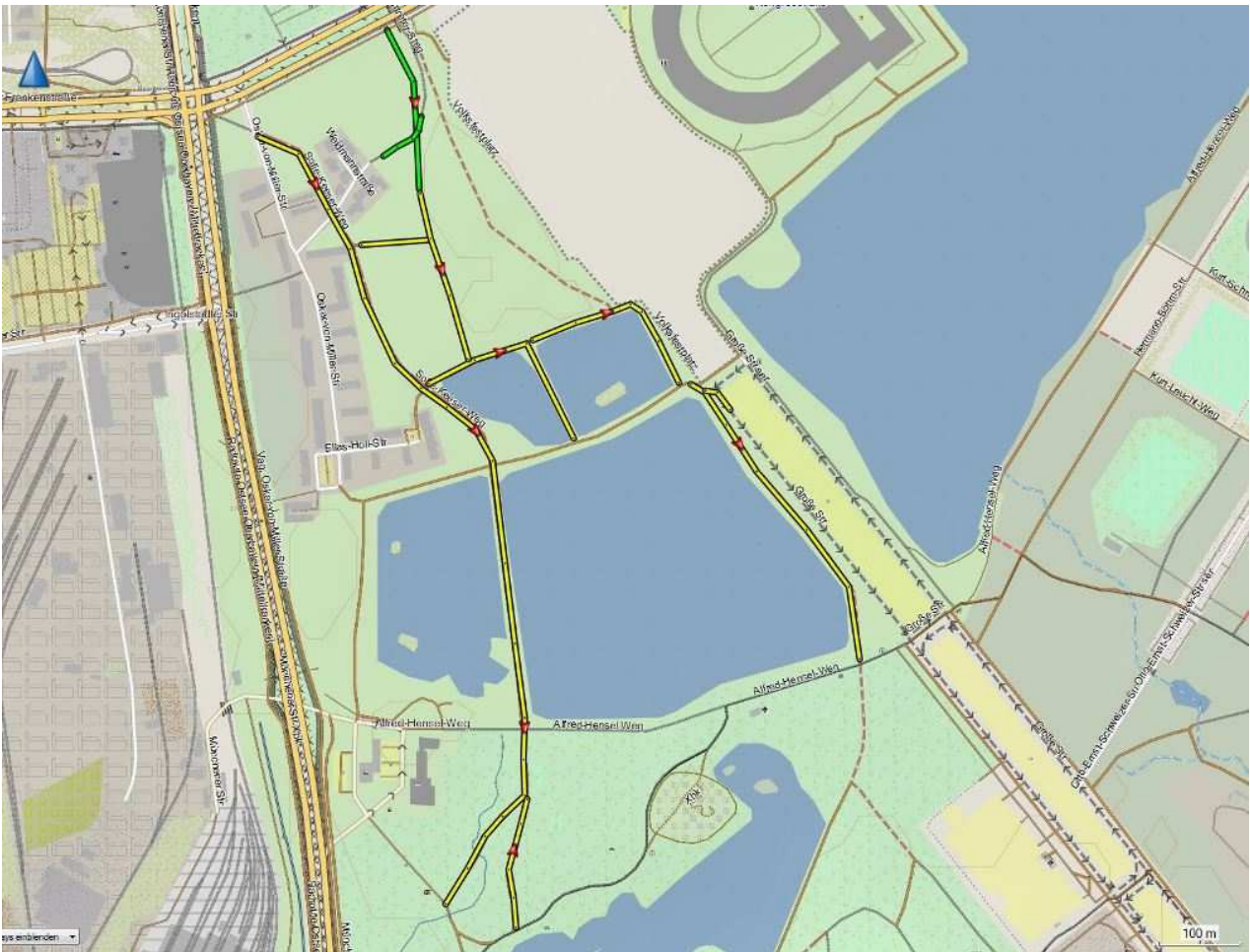
Defekte Wege im nördlichen Volkspark Dutzendteich